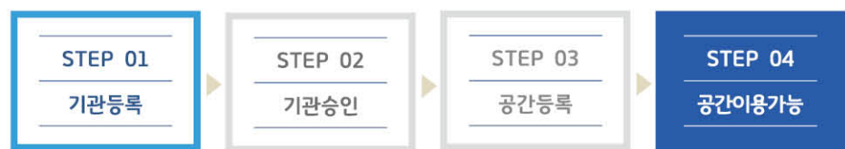
<그림 1> 공유공간 등록절차

공간제공자가 학습공간을 등록하려면 어떠한 절차를 거쳐야 하는지를 설명하고 이와 관련한 매뉴얼을 제공함으로써 공간제공자가 쉽게 공간을 등록하고 예약현황을 확인할 수 있도록 제공하였다.